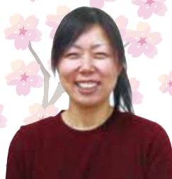
施設担当者様より

2020年11月、特定技能の在留資格を持ったインドネシアの青年2名が配属となりました。弊社には2年前より技能実習生が勤務していますが、私自身と一緒に働くのは初めての経験なので、配属前は「コミュニケーションはどの程度とれるのか?」「どのように業務を伝えていけばよいのか?」と色々心配していました。しかしその心配は、初日で払拭されました。ふたりとも日本語会話力もコミュニケーション能力もとても高く、驚きを隠せませんでした。ふたりが来てくれたことにより笑い声が増え、優しい声掛けや表情にはご利用者様も安心感を持たれており、今後さらに明るく活気のあるホームになるのではと、とても楽しみにしています。私たちも彼らの学びたいという熱心な思いに応えられるよう、日々関わりを深めていきたいと思っています。